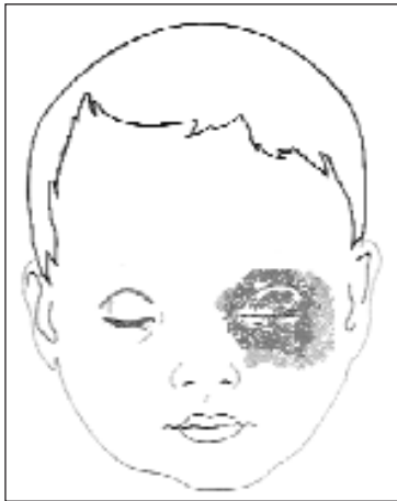
Ryc. 2. Zapalenie zatok sitowych z zajęciem oczodołu.

plywu żylnego. W kolejnej fazie dochodzi do przejścia stanu zapalnego na tkanki oczodołu poprzez naturalne dehiscencje błaszki oczodołowej, tworzącej przyśrodkową ścianę oczodołu. Rozwijające się w ten sposób zapalenie tkanek miękkich oczodołu klinicznie objawia się wytrzeszczem, zaczerwienieniem i obrzękiem obu powiek, spojówki powiekowej i gałkowej. Przy niepomysłnym przebiegu wystąpić może upośledzenie ostrości wzroku. W kolejnych fazach zapalenia sitowia może dojść do rozwoju innych groźnych powikłań: ropnia podokostnowego, ropnia oczodołu czy zakrzepowego zapalenia zatoki jamistej.